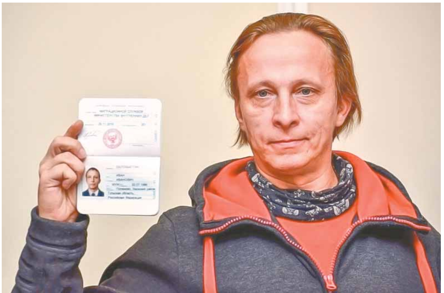
Иван Охлобыстин с паспортом «гражданина ДНР».