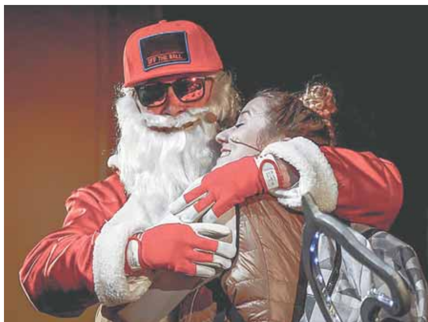
Сцена из спектакля «Мой папа – Дед Мороз».