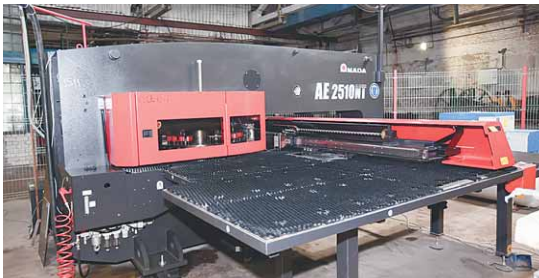
Фактически завод продолжает существовать, работая под другим названием – «Zencha-Псков».