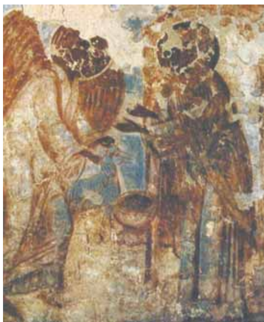
Явление ангела преподобному Симеону Дивногорцу. Роспись южной стены церкви Рождества Христова в Довмонтовом городе. Фрагмент.