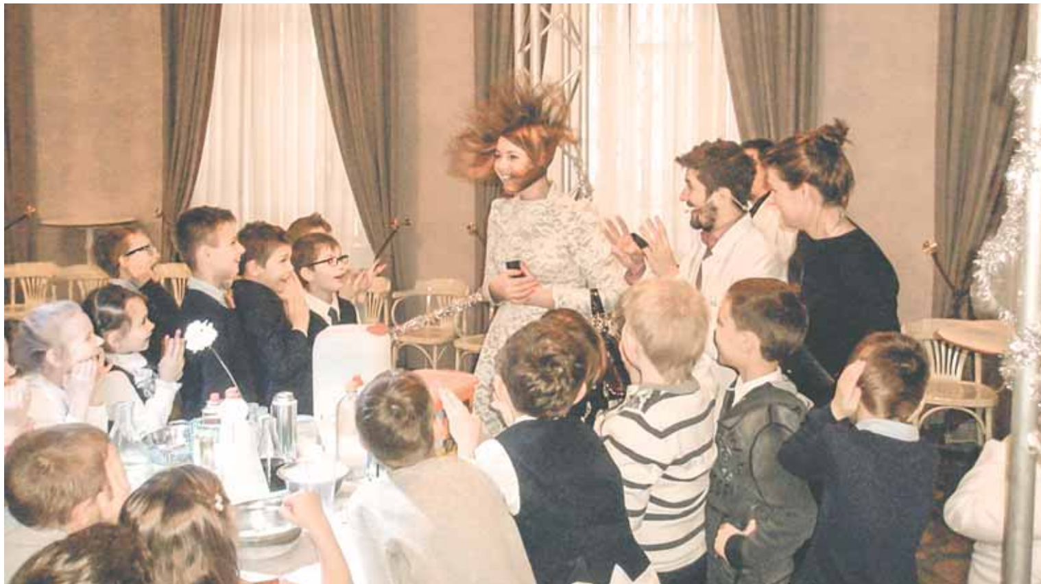
Шоу «Открывашка»: «Новогодние бусы Ньютона» в театральном буфете.