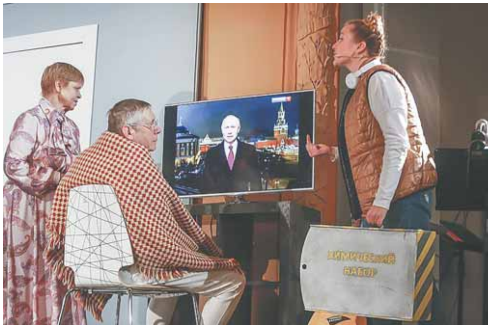
Сцена из спектакля «Мой папа – Дед Мороз».

* Spelling (написание) – способ, за счёт которого рифмуется текст, передавая его содержание.