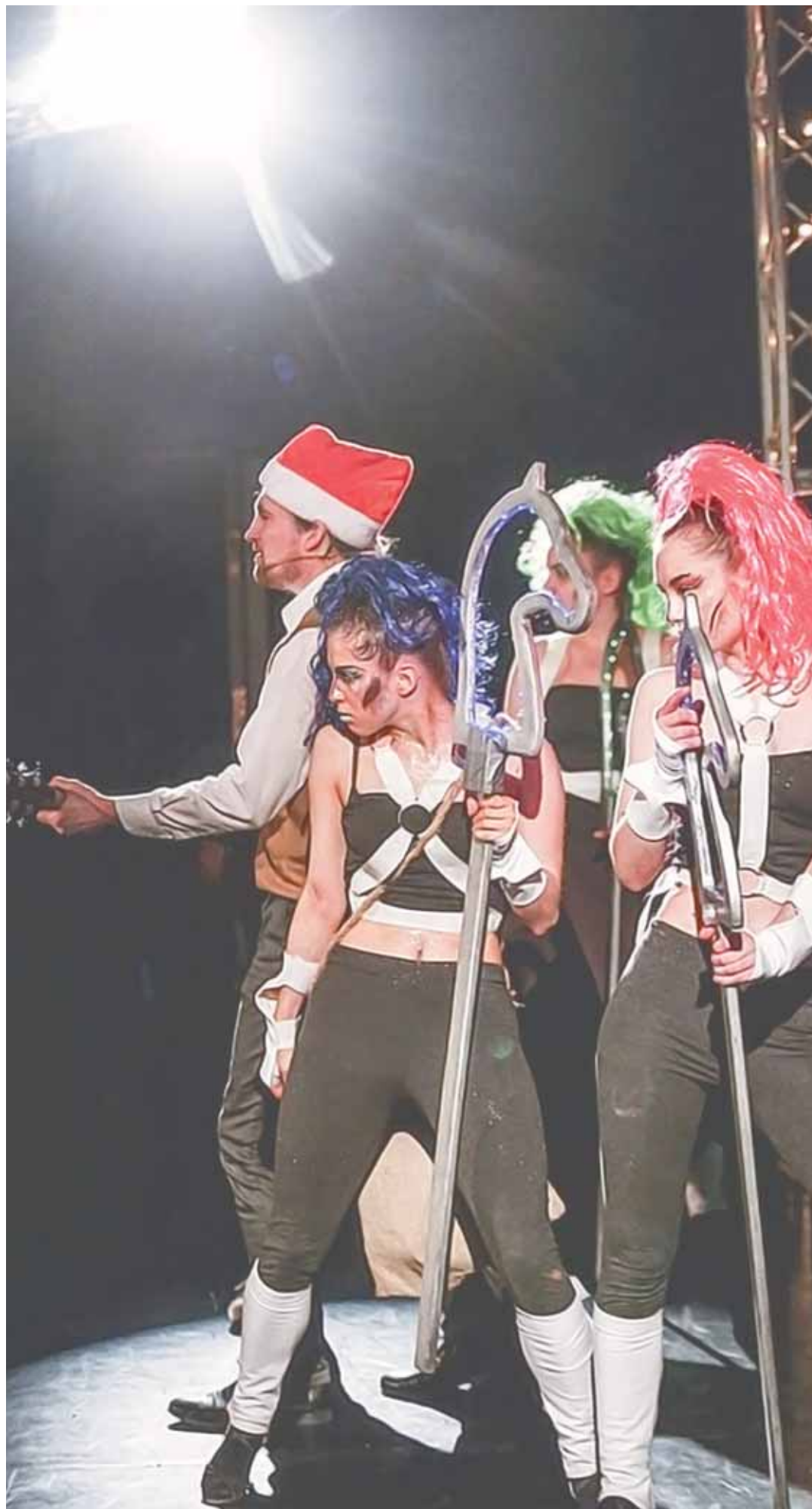
Сцена из спектакля «Мой папа – Дед Мороз».