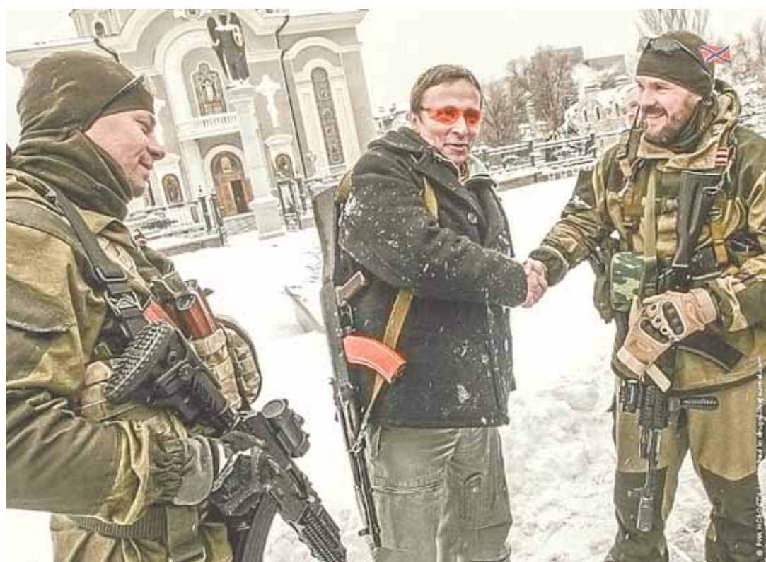
Иван Охлобыстин (в центре) в «ДНР».

ИВАН ОХЛОБЫСТИН НЕСКОЛЬКО РАЗ ВО ВРЕМЯ ПСКОВСКОГО КОНЦЕРТА-ПРОПОВЕДИ ПОВТОРЯЕТ КЛЮЧЕВЫЕ ПОНЯТИЯ СВОЕЙ ИДЕОЛОГИИ: «ГОТИКА, МИЛИТАРИЗМ, РАШИЗМ, КРЫМ НАШ, ДОНБАСС НАШ... И НЕ ТОЛЬКО. ВСЁ НАШЕ!» КАК ПРАВИЛО, ПРОИЗНОСИТ ОН ЭТО С ХИТРОЙ УЛЫБКОЙ – КАК БЫ НЕ ВСЕРЬЁЗ И В ТО ЖЕ ВРЕМЯ ВСЕРЬЁЗ.