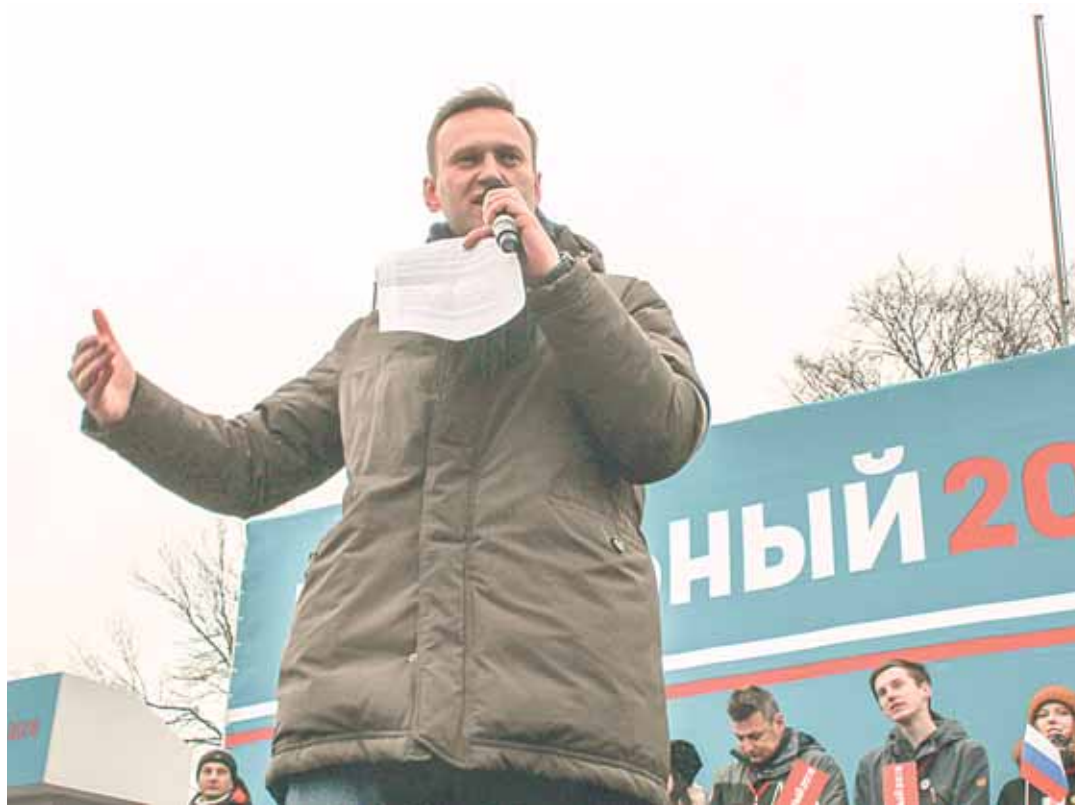
Выступление Алексея Навального в Пскове. Микрорайон Кресты, 2 декабря.

Был ли приговор уголовного суда по отношению к Алексею Навальному объективным? Нет, это был процесс не над предпринимателем Навальным, а над политиком Навальным. Европейский суд по правам человека признал, что Навального и Офицера лишили права на справедливое судебное разбирательство. Верховный суд России