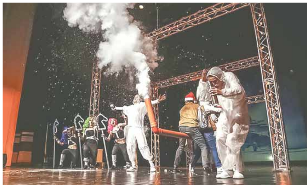
Сцена из спектакля «Мой папа – Дед Мороз».