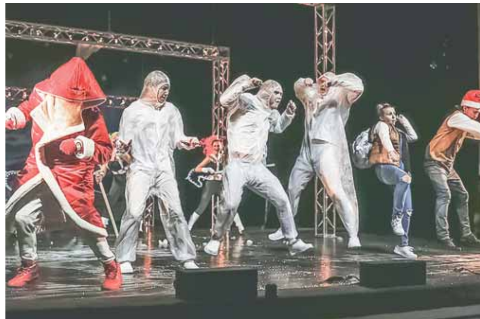
Сцена из спектакля «Мой папа – Дед Мороз».