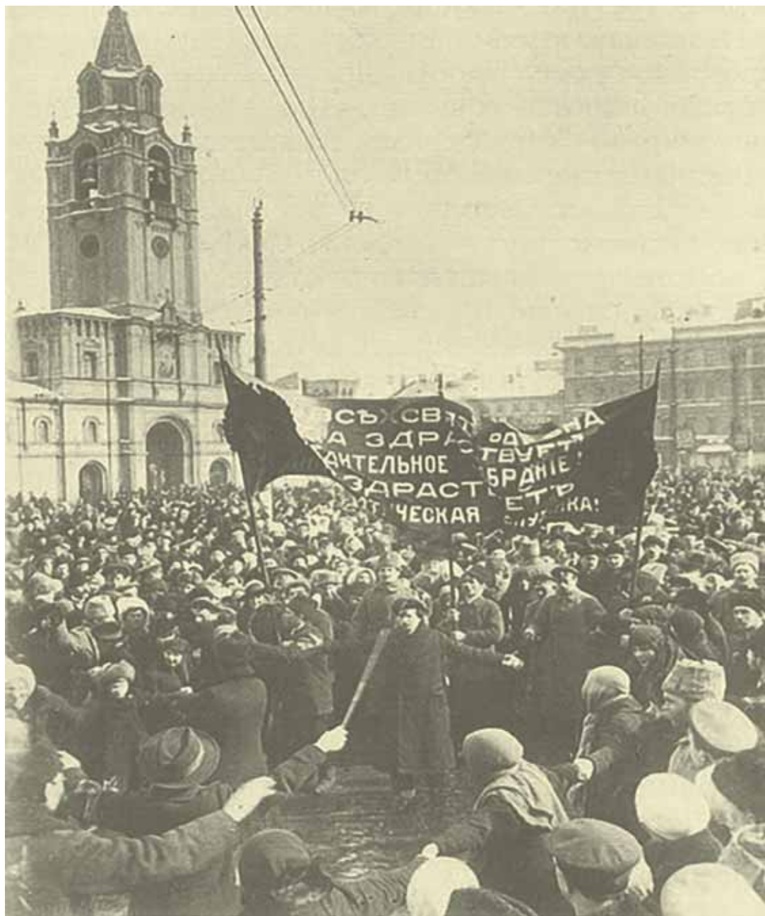
Манифестация на Страстной площади Москвы в поддержку Учредительного собрания в день выборов.