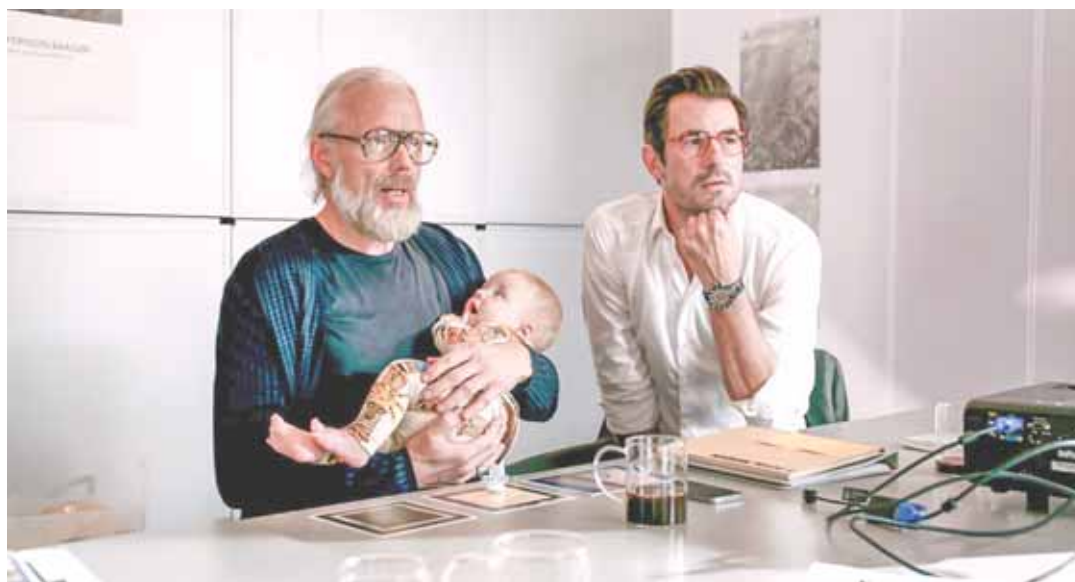
Кадр из фильма «Квадрат».

номиналом 100 крон; фото сделано на съемках мелодрамы 1931 года «Сьюзан Ленокс: Падение и взлёт» режиссёра Роберта З. Леонарда ). Одна эпоха сменяется другой. В начале Грета Ловиса Густафссон превратилась в Грету Гарбо, а потом и в картинку на банкноте.