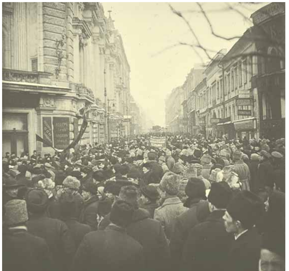
Демонстрация в поддержку Учредительного собрания.

«МИТИНГ ВСЁ-ТАКИ СОШЁЛ БЛАГОПОЛУЧНО, В ТОМ СМЫСЛЕ, ЧТО НАС НЕ ИЗБИЛИ»