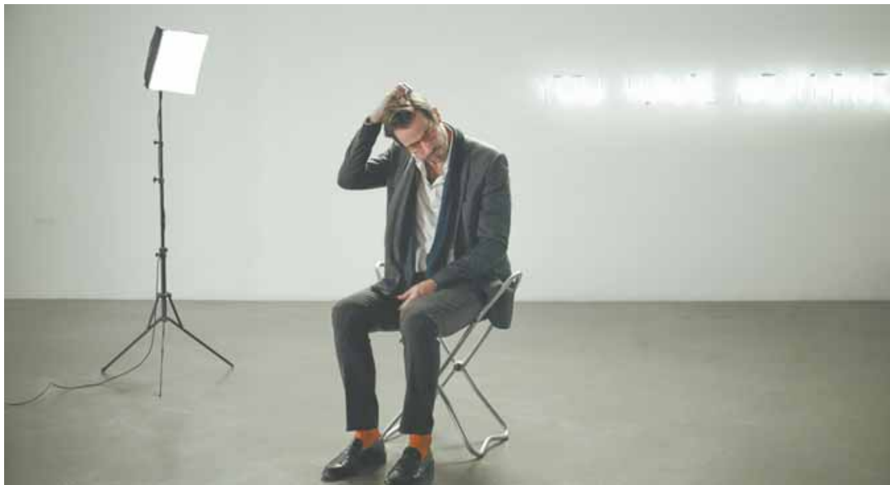
Кадр из фильма «Квадрат».