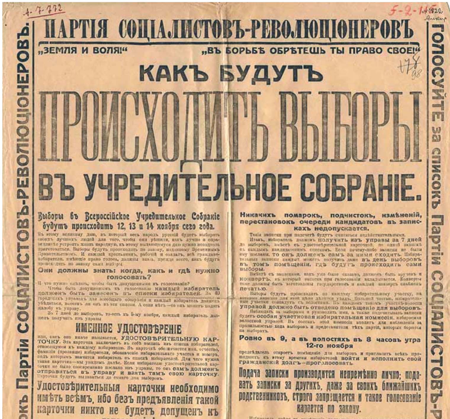
Листовка партии эсеров на выборах в Учредительное собрание.

отсутствии рабочих и солдат». Рабочие всё-таки были, но меньше, чем хотелось бы сторонникам Учредительного собрания.