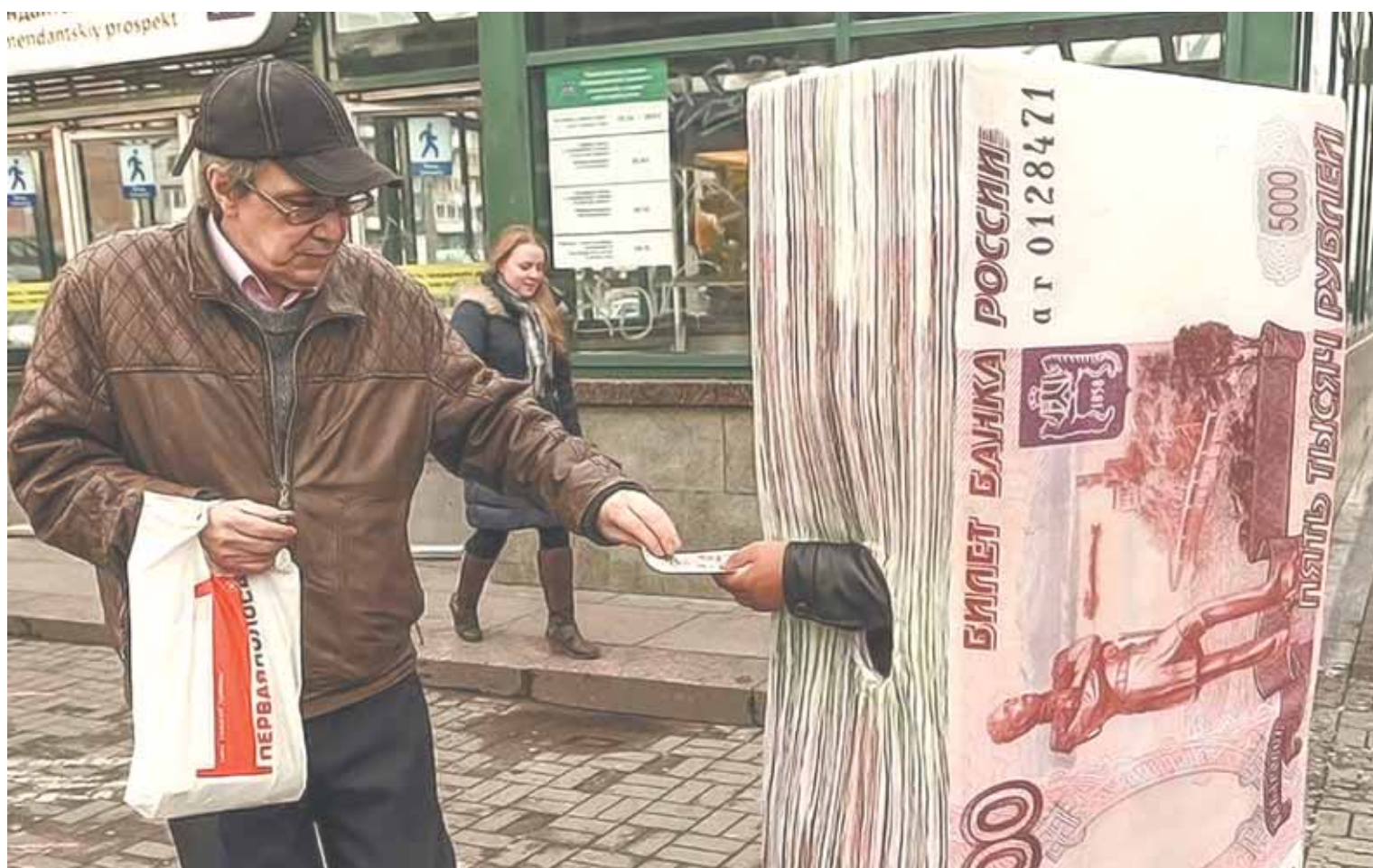
Граждане России в декабре 2017 года взяли 2,1 млн микрозаймов общим объемом 24 млрд руб., что стало абсолютным рекордом за последние десять лет.

Телевизор кричит гражданам России об их счастливой жизни, цифры это молча, но убедительно опровергают