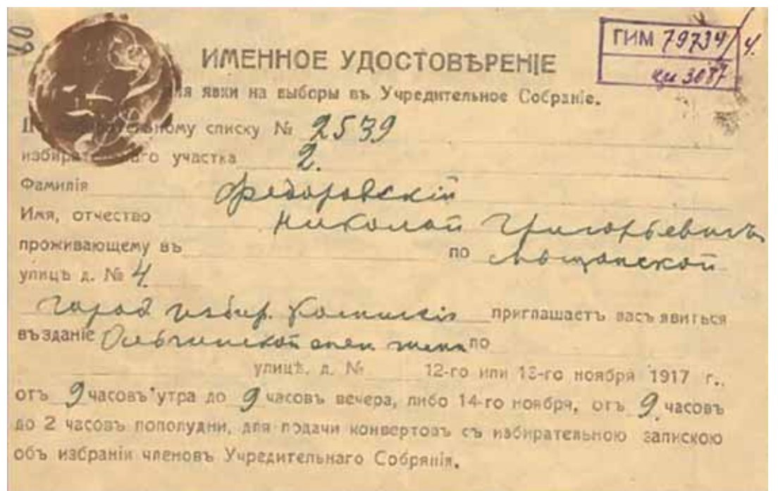
Именное удостоверение избирателя Всероссийского учредительного собрания.

В субботу, 28 октября 1917 года, большевики решили устроить в доме имени Пушкина (нынешнем драмтеатре) концерт-митинг с участием солиста Мариинской оперы Гуальтьера Боссе (бас). Афиши обещали: «У рояля свободный художник Борис Нахутин ... с речами выступят Лев Каменев и Иоффе-Крымский ». Концерт-митинг был платный (билеты от 1 рубля 40 копеек до 4 рублей 90 копеек).