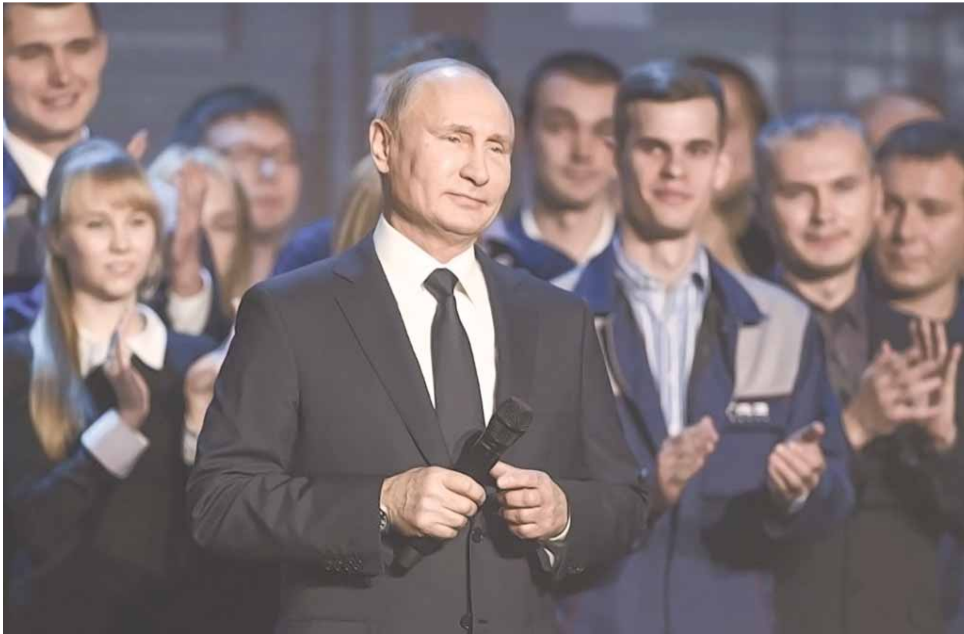
Среди кандидатов, имеющих шанс попасть в бюллетень, нет ни одного, кто способен одолеть Путина.