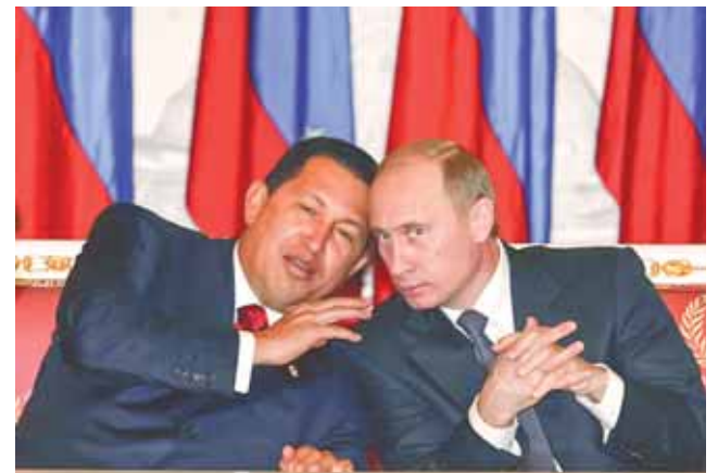
Уго Чавес и Владимир Путин.