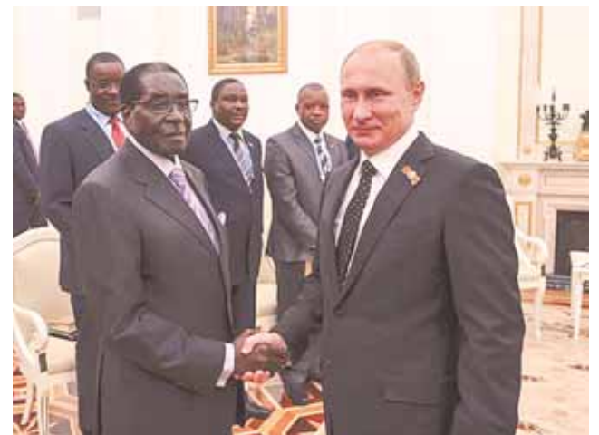
Роберт Мугабе и Владимир Путин.