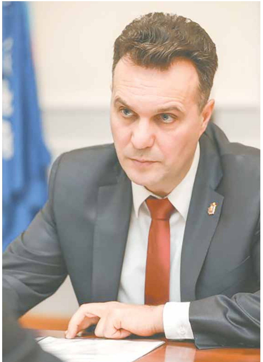
Николай Цветков был назначен вице-губернатором 27 ноября.