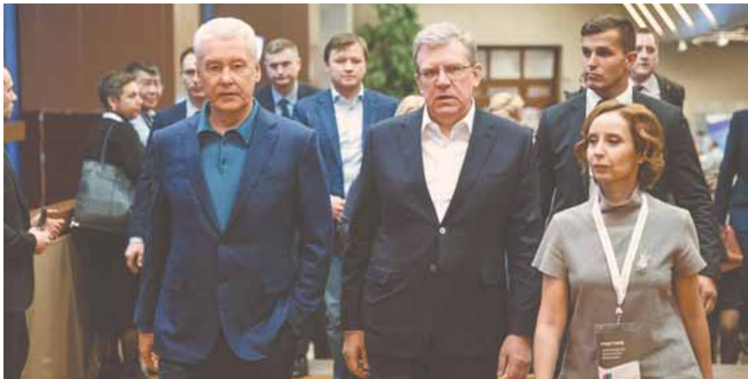
Как Алексей Кудрин и Сергей Собянин видят жителей России? Исключительно как часть производственных сил.

Человек в такой системе – не одушевленное творение, а производитель и покупатель товаров и услуг. И только в этом качестве он имеет значение. Людей в такой системе государственных координат нет, есть население – статистическая и