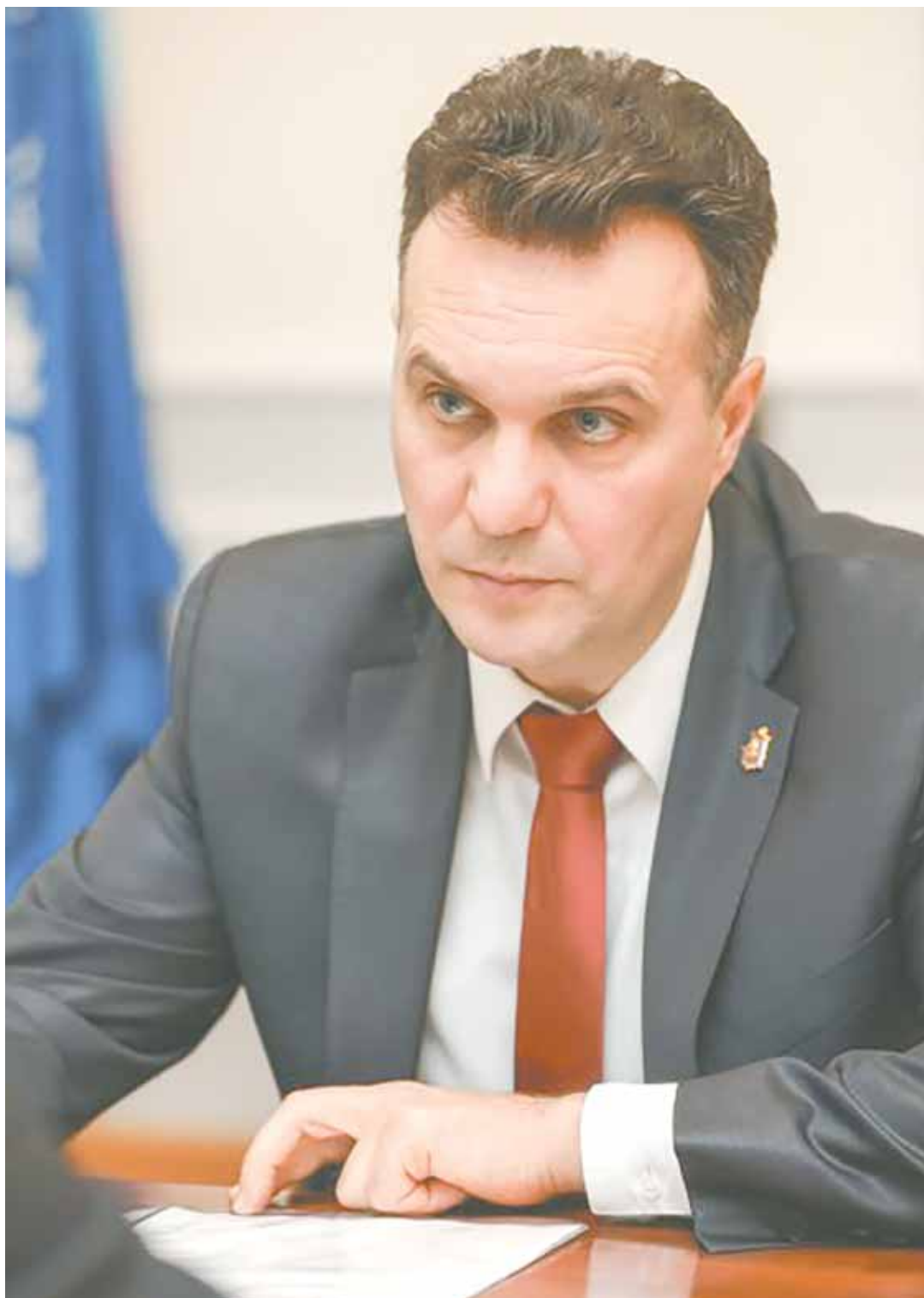
Николай Цветков был назначен вице-губернатором 27 ноября.