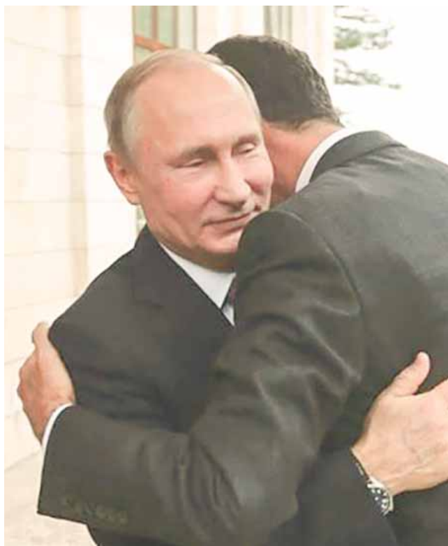
Владимир Путин и Башар Асад.

вам приходится прикидываться патриотом с утроенной энергией