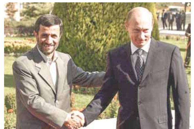
Махмуд Ахмадинежад и Владимир Путин.