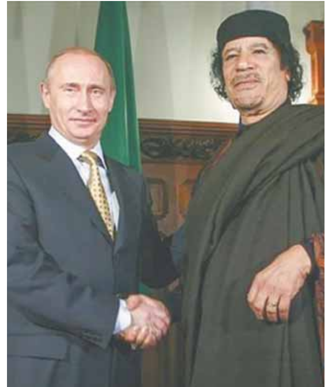
Владимир Путин и Муаммар Каддафи.

В последние годы международные успехи Российской Федерации, мягко говоря, невелики. Всё чаще