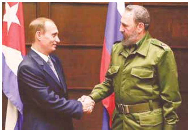
Владимир Путин и Фидель Кастро.