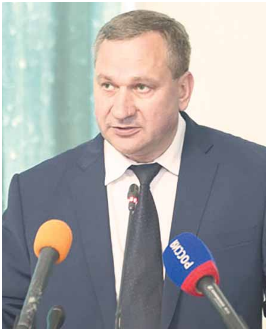
Иван Цецерский пока, скорее всего, останется в публичной плоскости, но, видимо, будет терять влияние, в частности при кадровых назначениях.