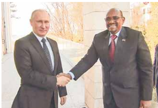
Владимир Путин и Омар аль-Башир.

наша страна оказывается в числе «стран-изгоев». Наиболее дружеские встречи Владимир Путин проводит именно с лидерами других государств-изгоев. В результате этим странам списываются многомиллиардные долги или делаются ещё какие-нибудь поблажки. На не слишком выгодных условиях туда отправляется российское оружие. Каких-то других общих интересов, кроме антиамериканизма, здесь не просматривается. Диктаторы стран-изгоев могут враждебно относиться друг к другу. Но с теми и другими Путин предпочитает дружить. Однако дружба иногда не помогает.