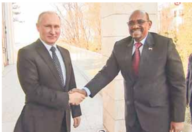
Владимир Путин и Омар аль-Башир.

наша страна оказывается в числе «стран-изгоев». Наиболее дружеские встречи Владимир Путин проводит именно с лидерами других государств-изгоев. В результате этим странам списываются многомиллиардные долги или делаются ещё какие-нибудь поблажки. На не слишком выгодных условиях туда отправляется российское оружие. Каких-то других общих интересов, кроме антиамериканизма, здесь не просматривается. Диктаторы стран-изгоев могут враждебно относиться друг к другу. Но с теми и другими Путин предпочитает дружить. Однако дружба иногда не помогает.