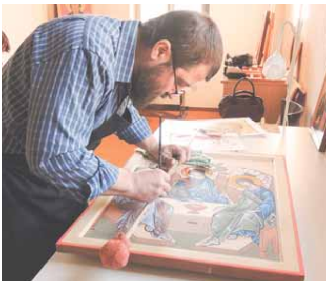
В Пскове Павел посещал приход Святой мученицы Анастасии, и для него он написал много прекрасных икон.

ПСКОВСКАЯ ГУБЕРНИЯ Выходит в свет с августа 2000 года