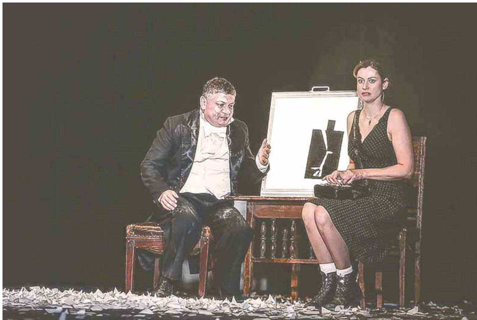
Сцена из спектакля «Город. Женитьба. Гоголь». Театр им. Ленсовета. Псков.

за «домомучительницей» множество людей по всему миру. Они хотят упорядочить всё и всех