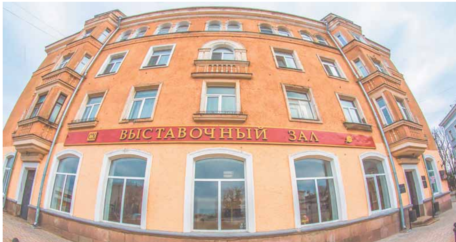
Выставочный зал центра имени Волошина. / Фото: архив «Псковской губернии»