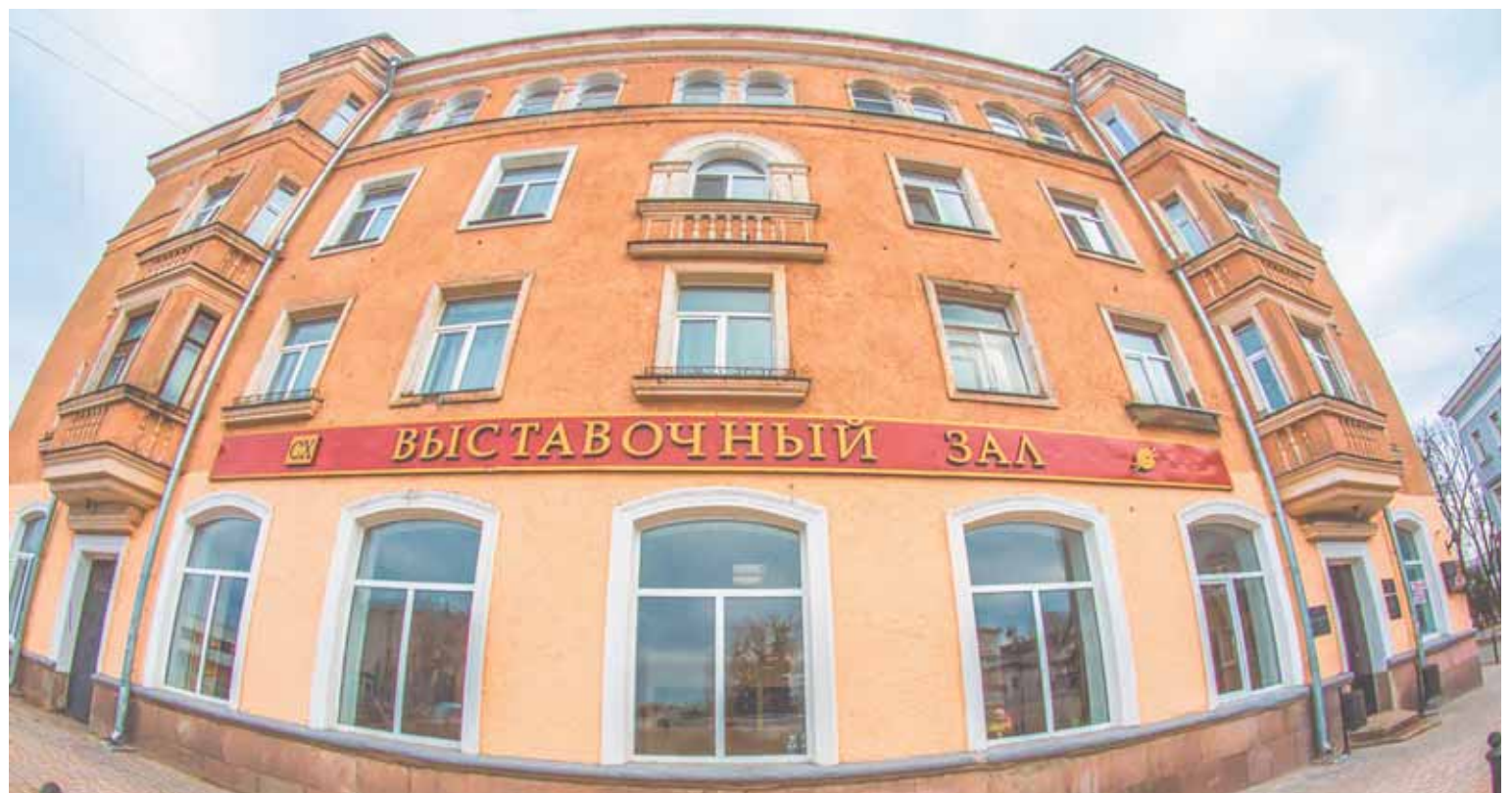
Выставочный зал центра имени Волошина. / Фото: архив «Псковской губернии»