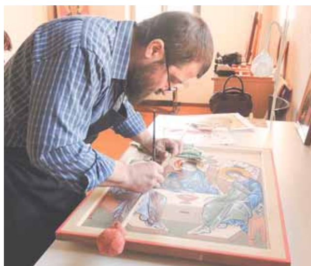
В Пскове Павел посещал приход Святой мученицы Анастасии, и для него он написал много прекрасных икон.

ПСКОВСКАЯ ГУБЕРНИЯ Выходит в свет с августа 2000 года