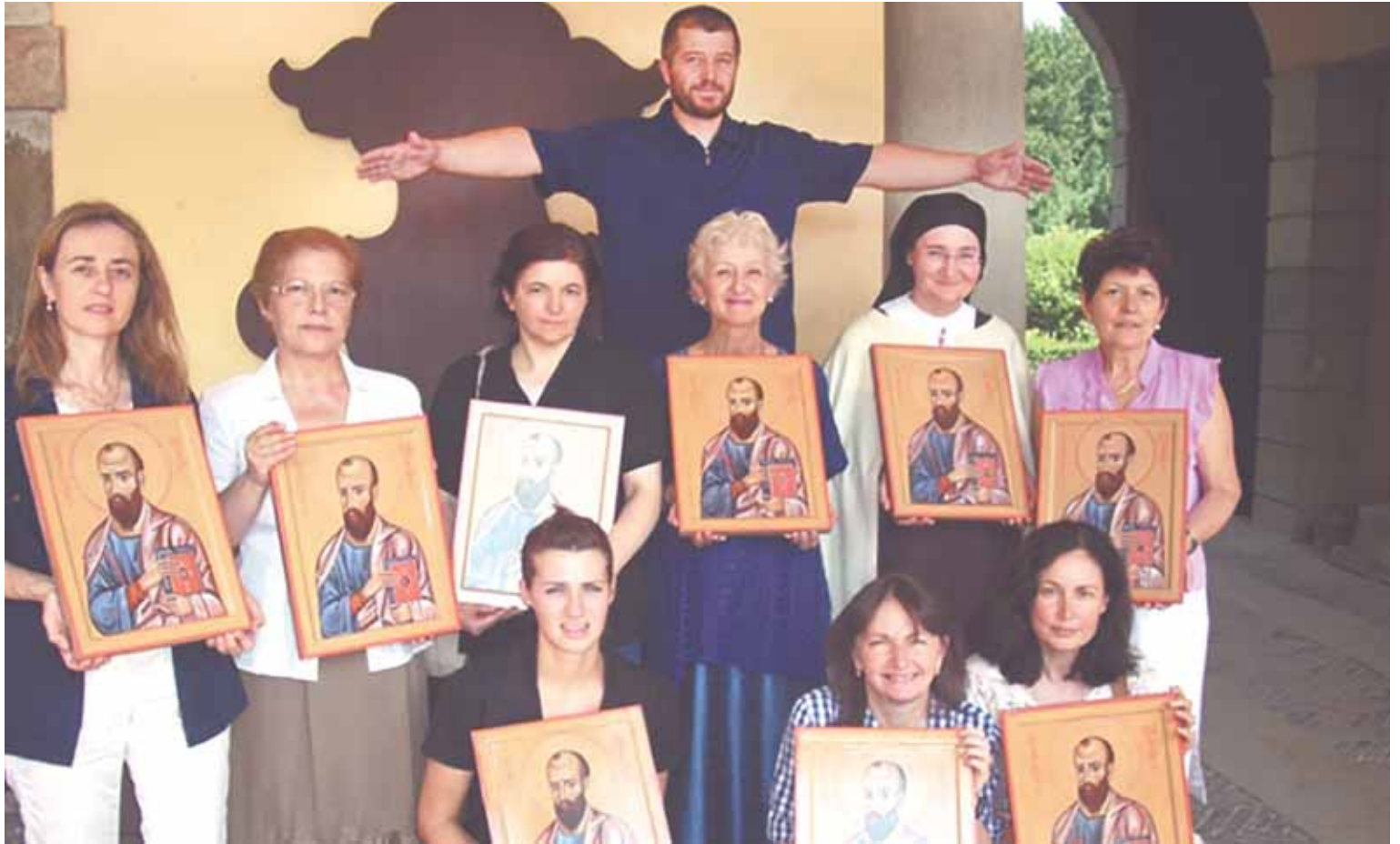
Иконописная школа в Сериате (Италия).

Эта его способность оставаться анонимным проводником традиции