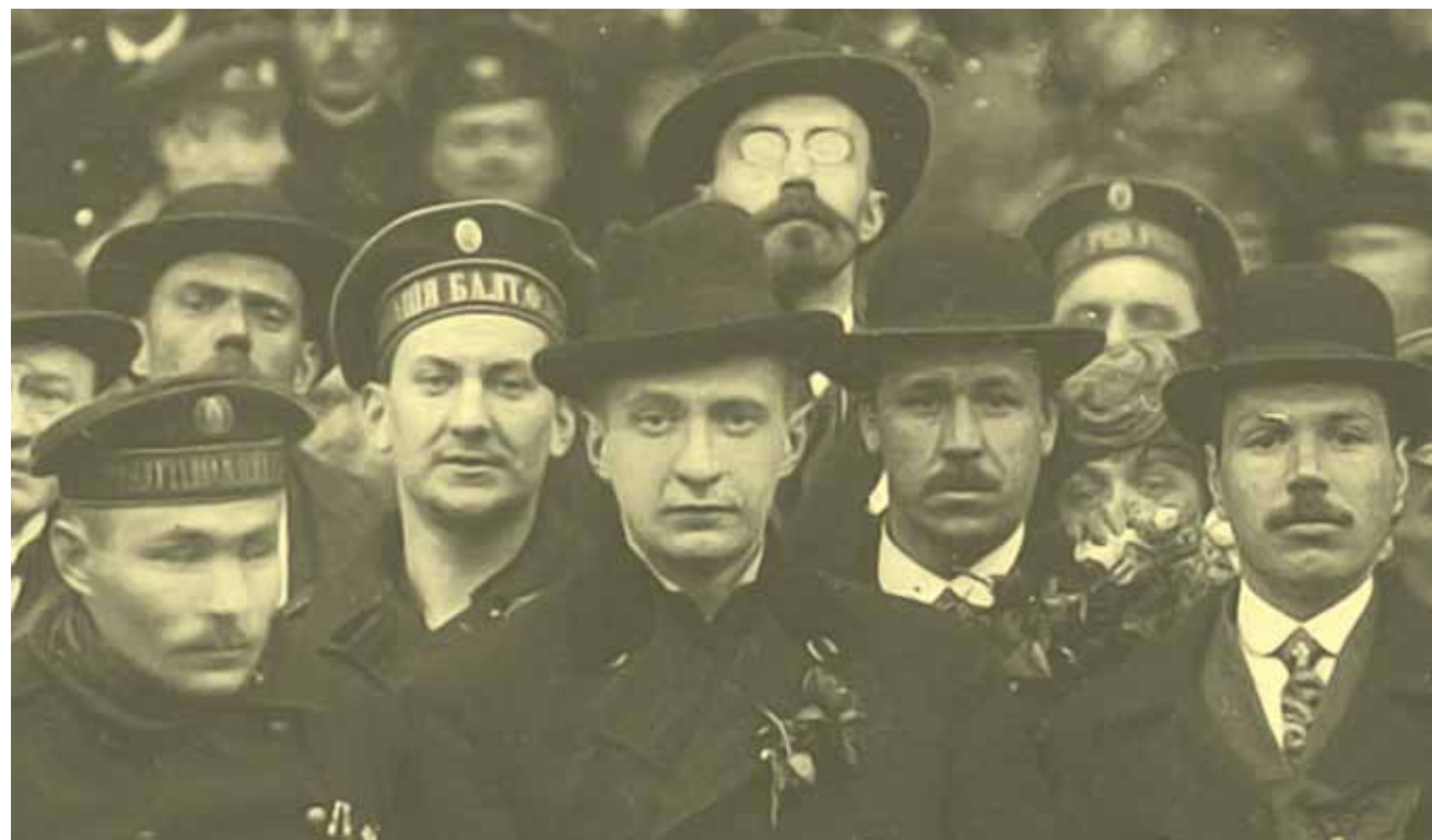
Александр Керенский в центре.