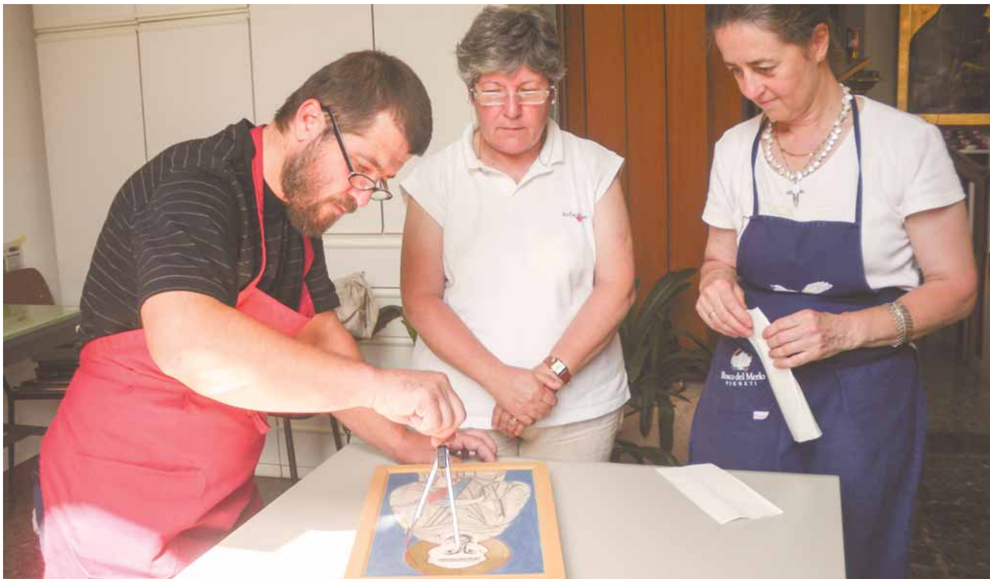
Впоследствии, когда отец Зинов, сделав выбор, решил навсегда оставить Гверстонь, монах Павел, по-видимому, остался охранять это место.