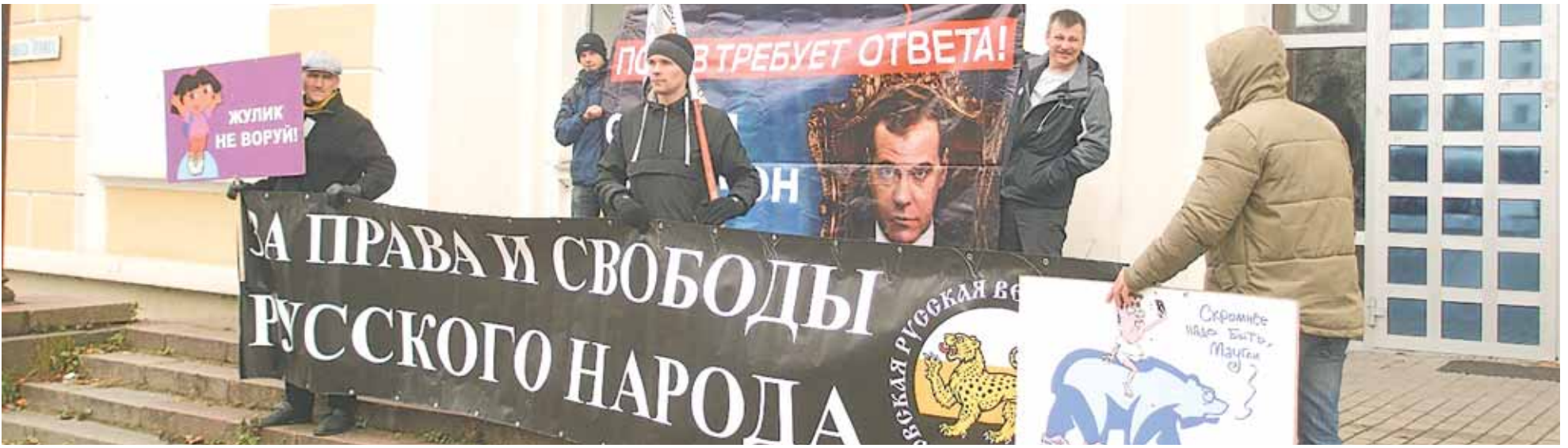
«Русский марш» в Пскове. 4 ноября 2017 года.