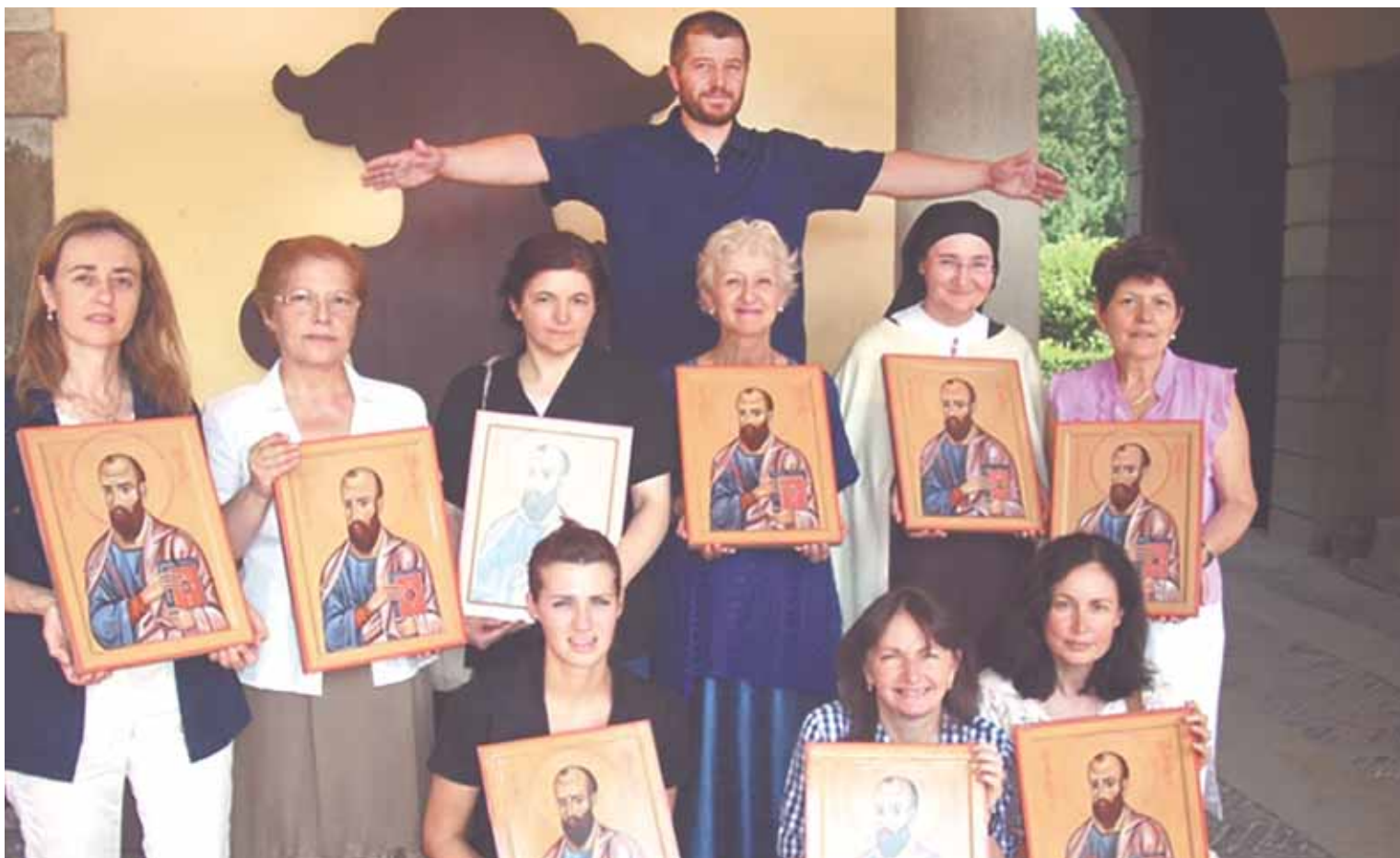
Иконописная школа в Сериате (Италия).

Эта его способность оставаться анонимным проводником традиции