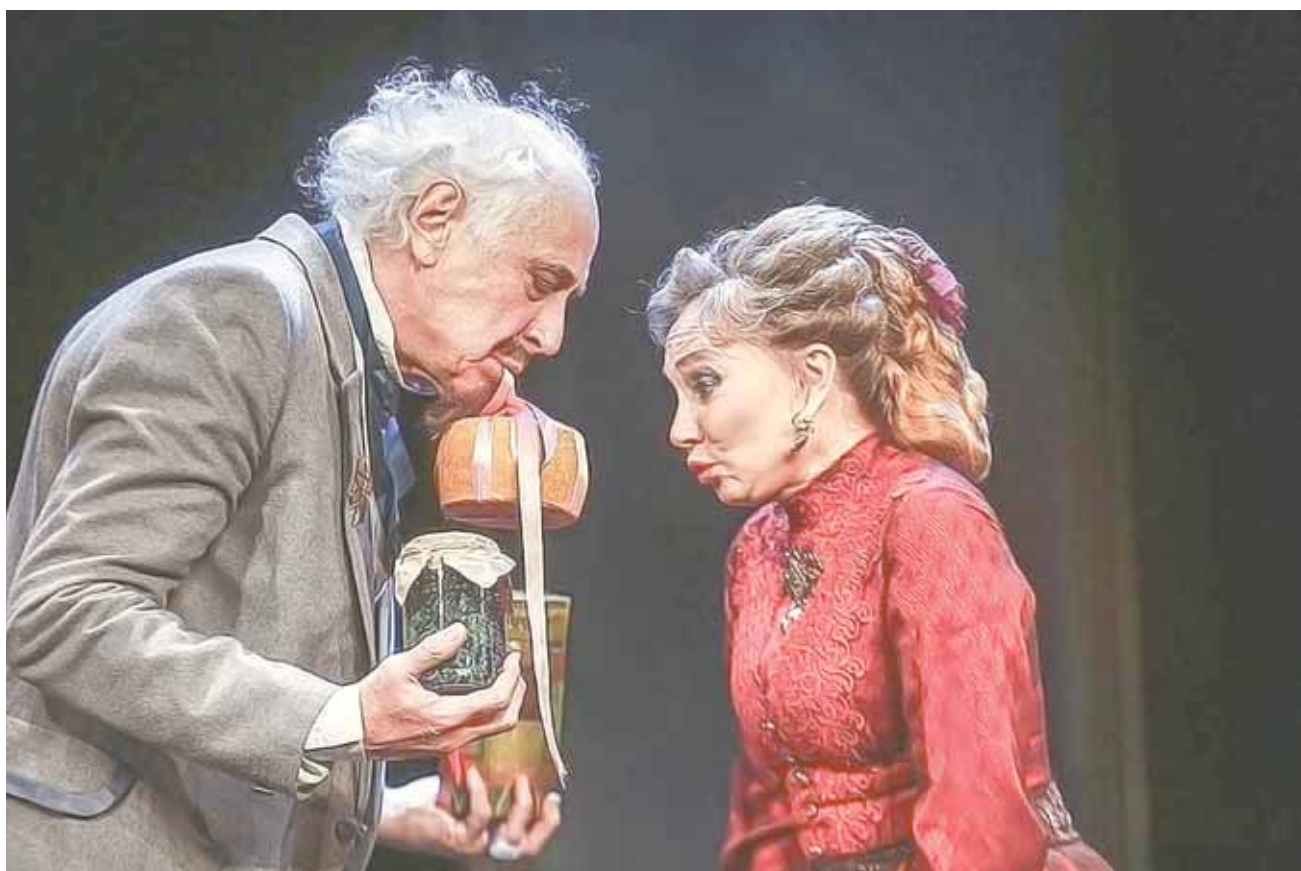
Сцена из спектакля «Без вины виноватые». Театр им. Ленсовета. Псков.

и бывала в Псковской области, но никаких спектаклей в Пскове точно раньше не играла. Её с кем-то перепутали. Хотя перепутать Анну Ковальчук с кем-то трудно. И не только потому, что она тоже хорошо известна по телесериалам («Тайны следствия», «Мастер и Маргарита»). Просто её игру на сцене трудно