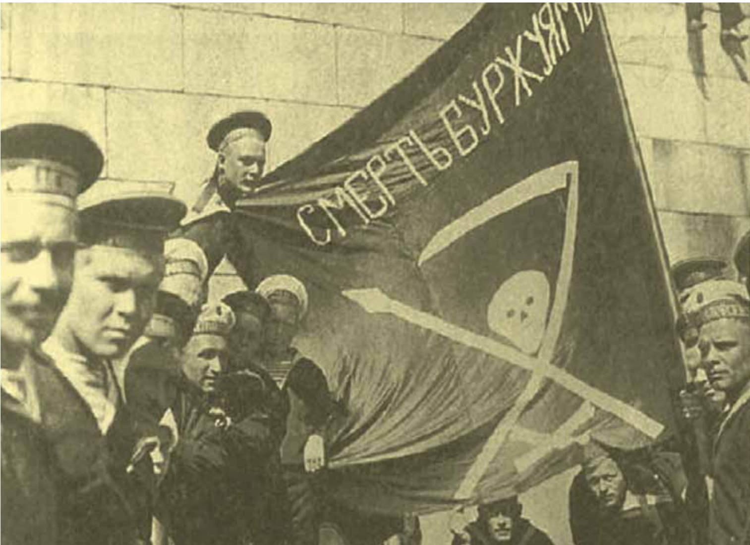
Революционные матросы-большевики с флагом «Смерть буржуам!». 1917 год, Петроград.

Октябрьский переворот 1917 года совершили люди, которые не могли выиграть честные выборы