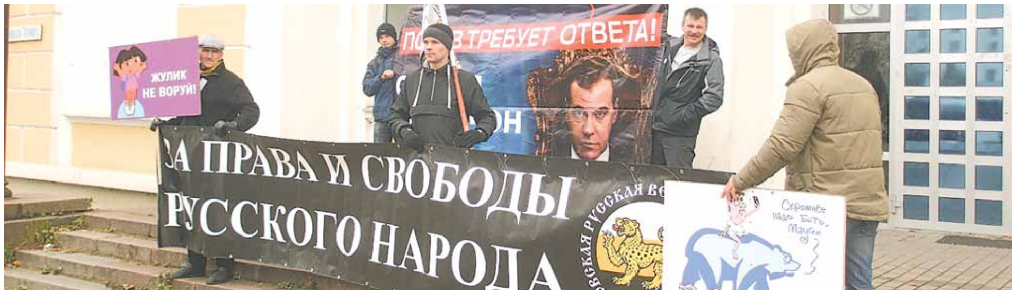
«Русский марш» в Пскове. 4 ноября 2017 года. / Фото: Алексей Семёнов